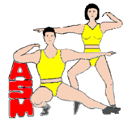
Association sportive Mex

L'Association sportive de Mex organise le dimanche 12 août une sortie dans la région de Morgins (Valais), comprenant une marche 3 heures (avec arrêt pic-nic), suivie d'un moment de relaxation dans les bains thermaux de Val d'Illiez et d'une agape dans une auberge. Transport groupé en voitures privées.