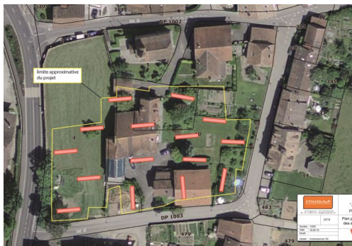
Fouilles d'origine prévues

D'abord il y a eu une inspection du site pour déterminer les endroits de fouilles, ensuite, les points de creuse ont été définis, voir les plans ci-dessous :