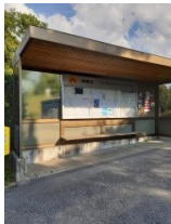
Mex Village (arrêt ligne 56)